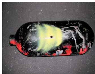
Sachgemässe Anlieferung Flüssiggas-Tank/Gasflasche: Beispiel demontierter Gasflasche mit Lochung