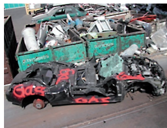
Sachgemässe Anlieferung Fahrzeug: LPG-Fahrzeug mit Kennzeichnung «Gas»